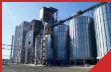
Комплекс зданий и сооружений ОАО «Макфа» Алтайский край, с.Троицкое