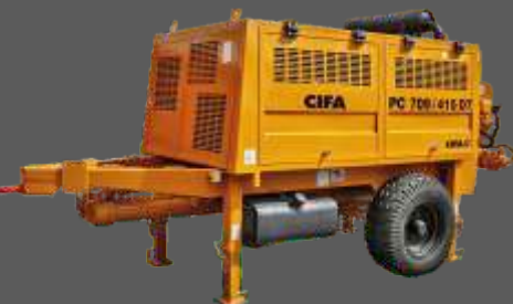
CIFA 709/415 D7