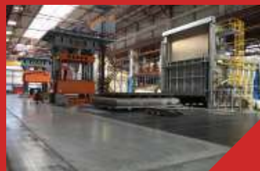
Реконструкция трубосварочного цеха №8 ОАО «ЧТПЗ», г. Челябинск