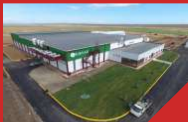
Виноградный питомник «Южная». Краснодарский край, пос. Таманский