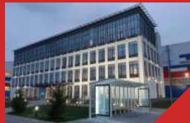
Административно- бытовое здание «Транснефть»