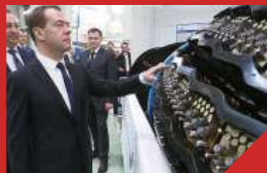
АО «Транснефть Нефтяные Насосы»