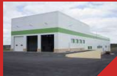
Завод по переработке биологических отходов