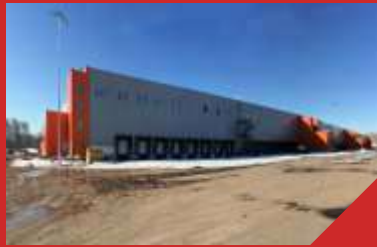
Логистический комплекс ООО "Логоцентр»