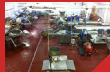
Нежилое здание колбасного цеха ММК. Реконструкция