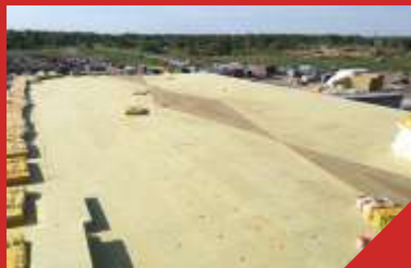
Цех убоя ООО "Агрофирма Ариант»