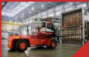
Завод «Трубодеталь» г.Челябинск