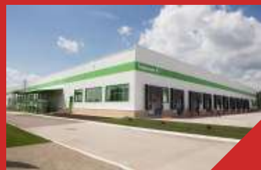
Производственный корпус МПК «Ариант», рзд. Серозак