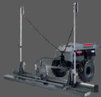
COPPERHEAD XD 3.0