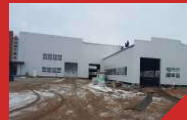
ООО КПК «НИСМА» цех металлообработки