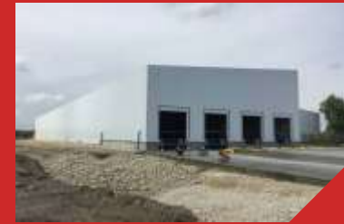
Склад готовой продукции ООО «Кубань-Вино»