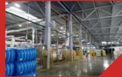
Строительство цеха химволокна АО «Втор-Ком»