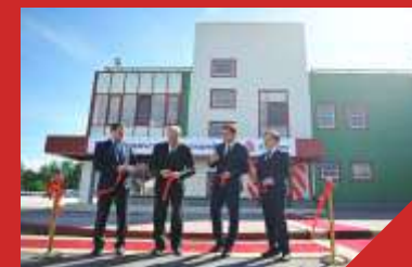
Мясоперерабатывающий завод ООО «Богданович»