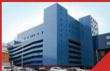
Многоуровневая парковка бизнес-центр «Челябинск Сити» г.Челябинск