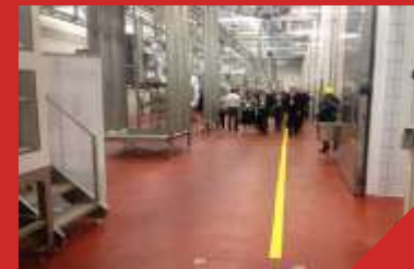
Строительство очистных сооружений «Оренбив»