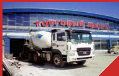
Челябинский «Торговый центр». Реконструкция цокольного этажа