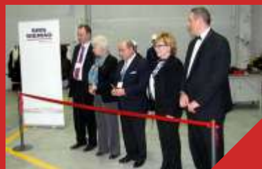
Завод по покрытию медных плит кристаллизаторов «МНЛЗ», г. Челябинск